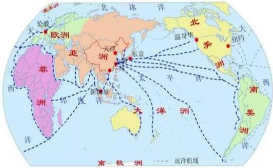
中国主要远洋航线分布