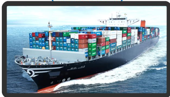
支线集装箱船 (FEEDER CONTAINER SHIP)